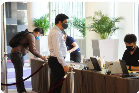
การประชุมสามัญผู้ถือหุ้นประจำปี 2563